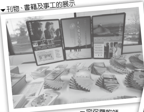
▼ 刊物、書籍及事工的展示