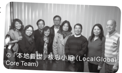
◎「本地普世」核心小組 (LocalGlobal Core Team)