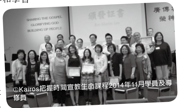
◎Kairos把握時間宣教生命課程2014年11月學員及導修員

Core Team，上圖2)，成為宣教團契，亦是推動本地跨文化宣教的策動團隊。此核心小組由辦事處主任引