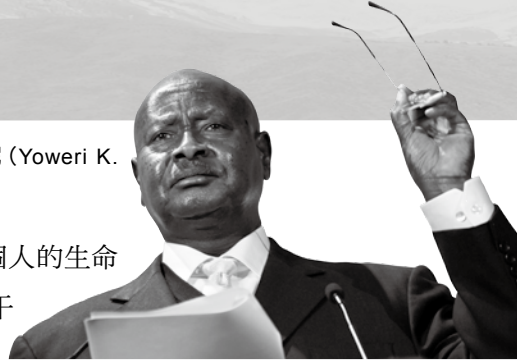
■烏干達總統約章里·穆塞維尼 (Yoweri K. Museveni; 1944年-)

靠主敬虔度日，堅守崗位。我們不能只把問題消極地歸咎於外在因素，卻忘記和推卸了自身該有的本分與責任。一切當從我們的內在省思開始，到底我們應有甚麼更積極的回應和行動？信徒在這萬變世代的思潮洪流中，難免遇到衝擊，甚至在信仰上迷失自己和向世界妥協。普救主義 (Universalism)、相對主義 (Relativism)、多元主義 (Pluralism) 和自由主義 (Liberalism) 等對教會都有不同程度的影響；然而，根據年前的調查顯示，全球（尤其西方）大多數的福音派領袖都認為世俗主義 (Secularism) 才是對福音派教會的最主要威脅。這表示基督教所面對的最大威脅並不是來自外在勢力（如伊斯蘭教的擴張等），乃教會本身內部的生命素質。這值得華人教會的深思和反省，不要在不知不覺間被世俗潮流、文化所蠶食，免得不攻自破！