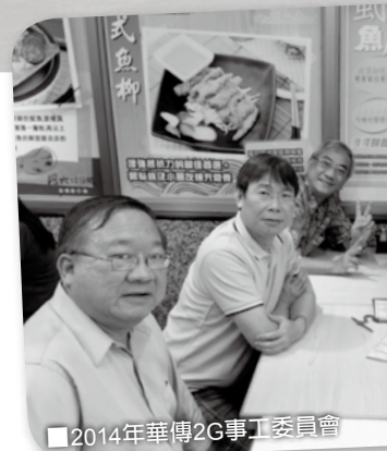
■ 2014年華傳2G事工委員會

當 我們談到如何動員2G (2nd Generation: 土生華裔) 下一代作宣教事工的時候，我們絕對不可以忽略先討論如何動員教會來完成耶穌基督的大使命。正因為所有財力和人力的資源，其實都是源自教會，故此教會若不先被動員或復興起來，我們就不可能談到動員教會的下一代去參與宣教的工作。作為教會夥伴的我們，都應同心迫切求上帝大大復興祂的教會；深信主耶穌比我們更關心祂的新婦——祂在地上的身體。