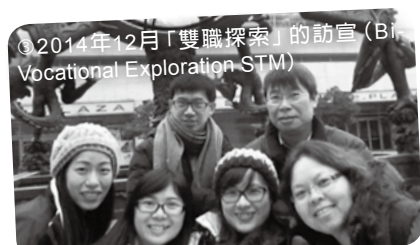
◎2014年12月「雙職探索」的訪宣 (Bi-Vocational Exploration STM)