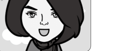
◎玲 (Meow) —— 雙職宣教士，她以專業的平臺，在亞洲多個福音未得的少數民族中作宣教服事